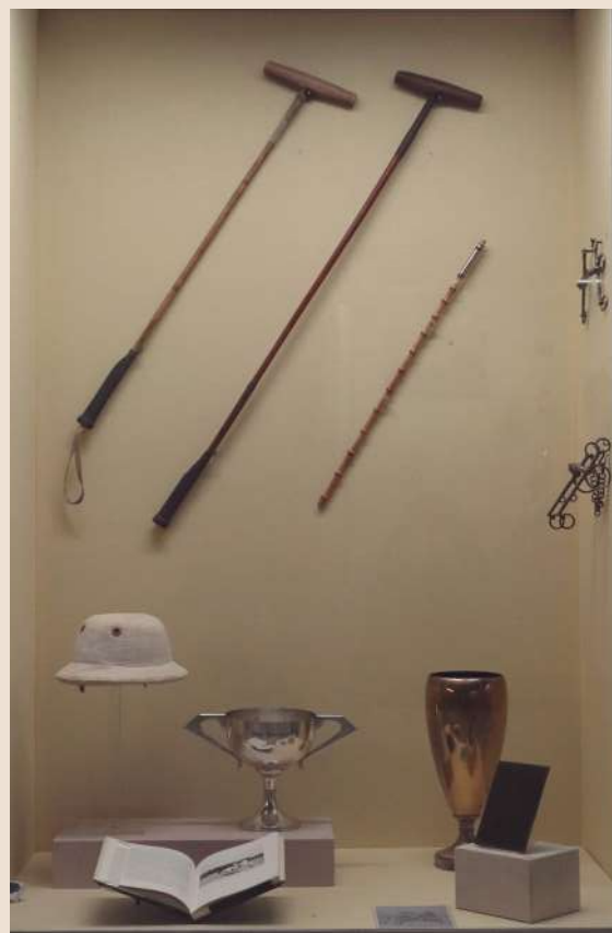
Vitrine présentant le polo moderne - © Château-Musée

Enfin, dans un troisième volet, sont présentés les jeux d'équipes les plus pratiqués : le polo, le pāto (horse-ball) et le buzkachi. Pratiques traditionnelles régionales devenues, pour les deux premières, des sports internationaux réglementés, ces confrontations de plusieurs cavaliers en terrain naturel illustrent la présence et la persistance d'une équitation de loisir sur différents continents. Les pièces de harnachement d'Amérique du sud, d'Asie ou d'Europe conservées à Saumur sont associées à des revues et à des œuvres graphiques illustrant les diverses pratiques, ainsi qu'à des objets utilisés par les cavaliers, empruntés au Musée du Sport de Nice ainsi qu'à la collection Émile Hermès de Paris.