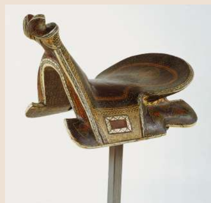
Selle Asie centrale Fin du XIX e siècle – début du XX e siècle Bois peint et laqué, ivoire ciselé