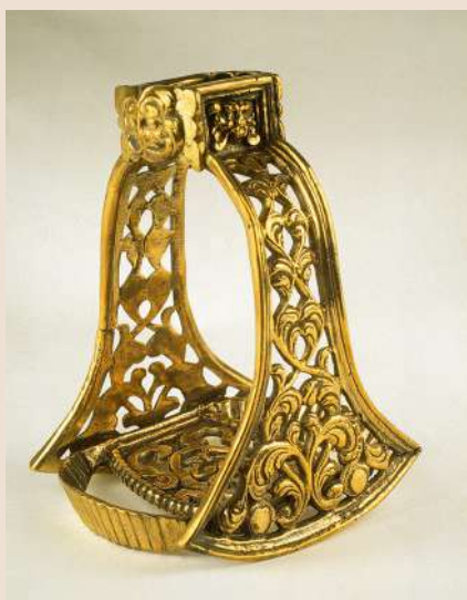
Etrier à branches ajourées s'élargissant vers le bas, plancher ovale ajouré Italie (?), XVI e siècle Bronze doré