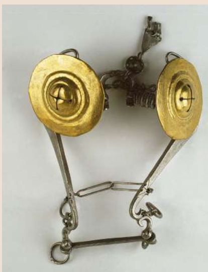
Mors de bride à canon à pas d'âne garni d'annelets, branches coudées, traverse, larges bossettes Fer forgé, laiton