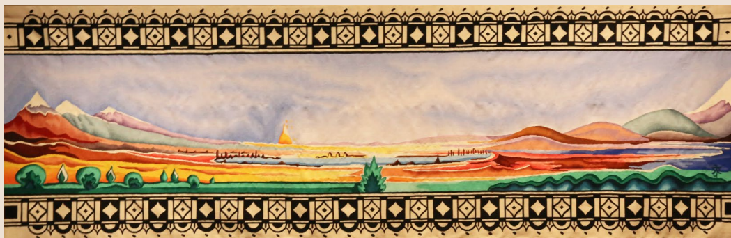
Mithrim, d'après une aquarelle originale de J.R.R. Tolkien pour The Silmarillion, 1927 © The Tolkien Trust 1927. Tissage Ateliers Pinton, Felletin 2019. Collection Cité internationale de la tapisserie. Œuvre réalisée avec le soutien de la Fondation d'entreprise AG2R LA MONDIALE pour la Vitalité Artistique, grand mécène de la tenture «Aubusson tisse Tolkien», de la Fondation des Pays de France du Crédit Agricole, du Tolkien Trust et avec l'aide du Fonds Européen de Développement Régional (FEDER).

Animations payantes, 2€ en supplément du droit d'entrée au château (pas de supplément pour l'atelier tapisserie).