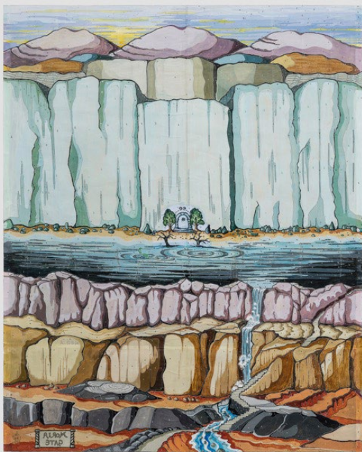
Moria Gate, d'après une aquarelle originale de J.R.R. Tolkien pour The Lord of the Rings , 1954 © The Tolkien Trust 1977. Tissage Atelier Françoise Vernaudon et Alexia V., Nouzerines 2021. Collection Cité internationale de la tapisserie. Œuvre réalisée avec le soutien de la Fondation d'entreprise AG2R LA MONDIALE pour la Vitalité Artistique, de la Fondation des Pays de France du Crédit avec l'aide du Fonds Européen de Développement Régional (FEDER).